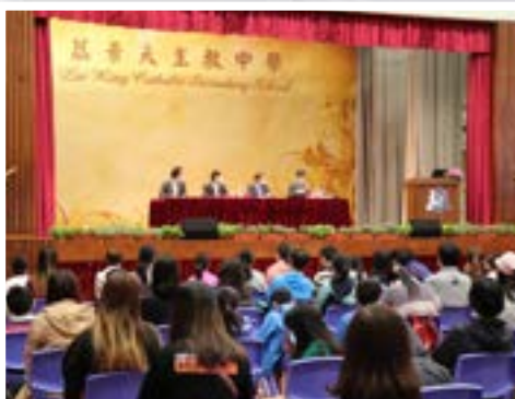
升中選校資訊講座