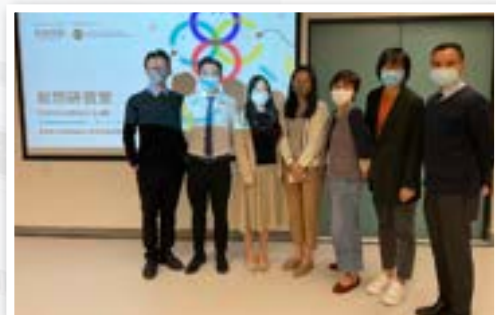
敢想研習室工作坊