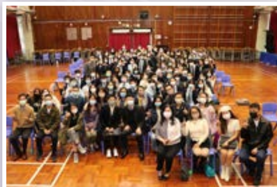
扶輪社電影欣賞會及分享會