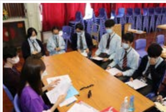
Life Rider 模擬工作體驗活動