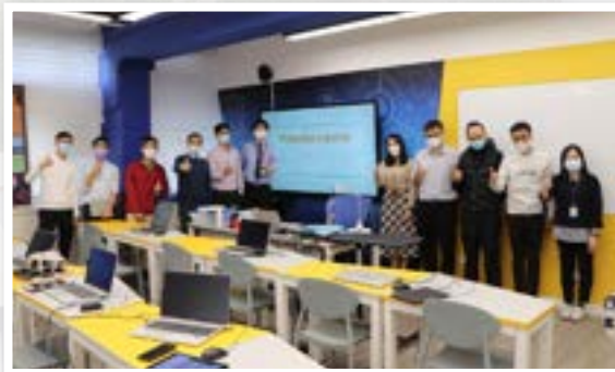
優質教育基金教學分享

本校有多名老師參加了「資優教育學校網絡計劃」，與教育局官員及友校老師進行交流，又舉辦中國語文科及中國歷史科的公開課，分享適異教學及其他有關課題，獲參與者的高度評價。本校參與了香港中文大學的「優質學校改進計劃」，大學教授及學者從學科的各層面促進本校教師的專業發展，例如：共同備課、教材及活動設計、同儕觀課及議課等。