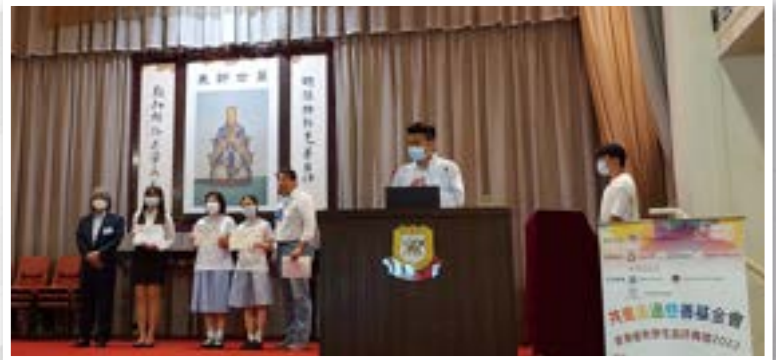
香港優秀學生嘉許典禮