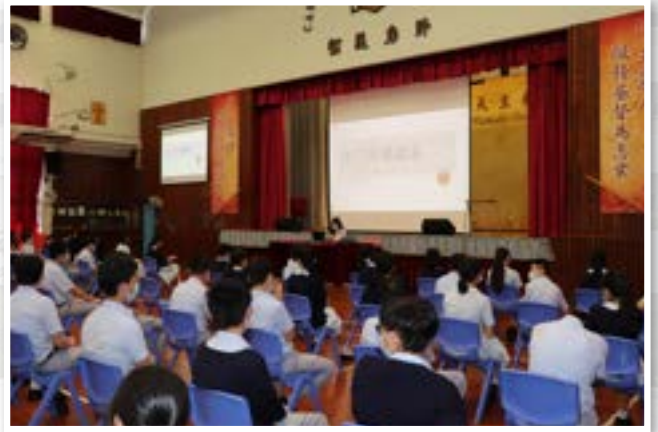
中三生涯規劃講座