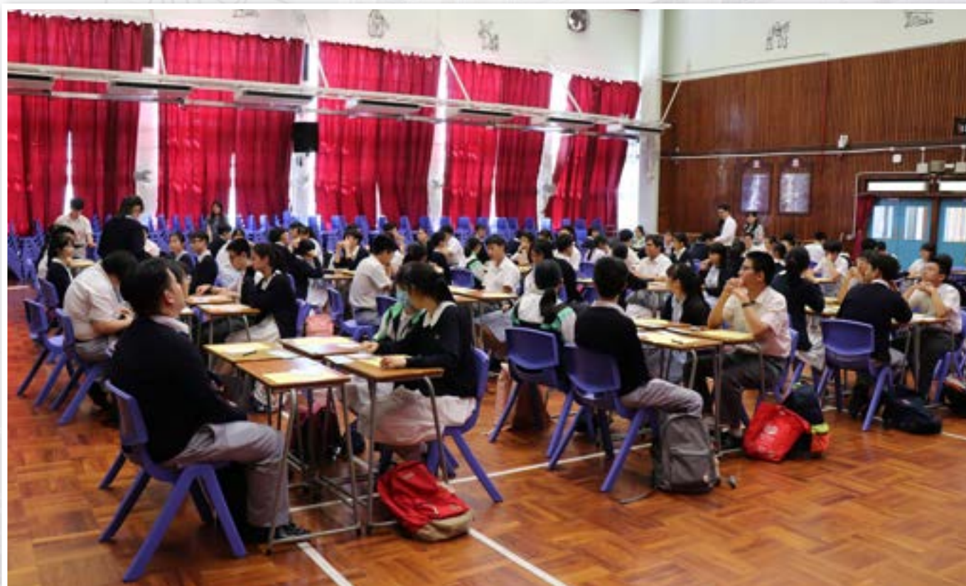
Joint school speaking practice