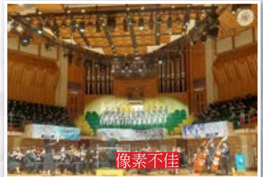
蒞天合唱團於香港文化中心比賽