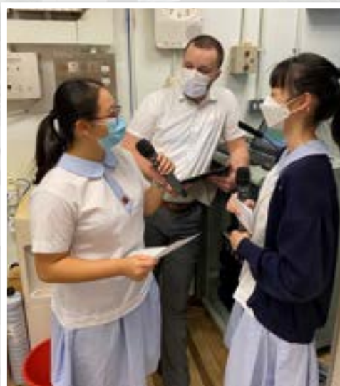
Our students and NET in the morning assembly

Enhancement classes are arranged for students to raise their language proficiency and cater for the needs of students with different abilities. In addition, the joint school speaking practice provides a platform for students to interact with students from different schools. Summer classes are arranged for students to prepare for the public examination.