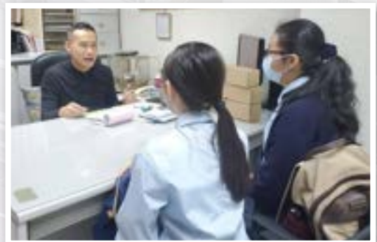
良師益友計劃學生到訪職場

自二零零七年起，香港都會扶輪社已與本校結為夥伴，歷任社長及社友均與本校師生合作無間，贊助多項學校活動，例如：探訪長者日。香港都會扶輪社又和生涯規劃委員會合辦「良師益友計劃」，透過師徒配對，學生有機會跟扶輪社的社會賢達學習及交流，有助鞏固學生未來升學或就業的基礎。