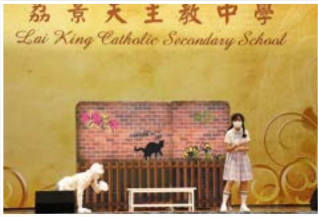
香港藝術節互動劇場