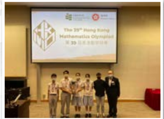
第三十九屆香港數學比賽亞軍