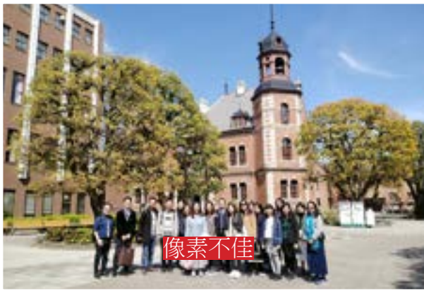
探訪日本關西大學

校友會透過各活動及計劃，聯繫歷屆校友，推動母校的發展。每年校友會均會聯同生涯規劃委員會，舉辦職業分享講座，為中五及中六級的學生，提供就業資訊。校友積極參與學校活動，又設立獎學金，獎勵在學業、品德及體育有傑出表現的學生。