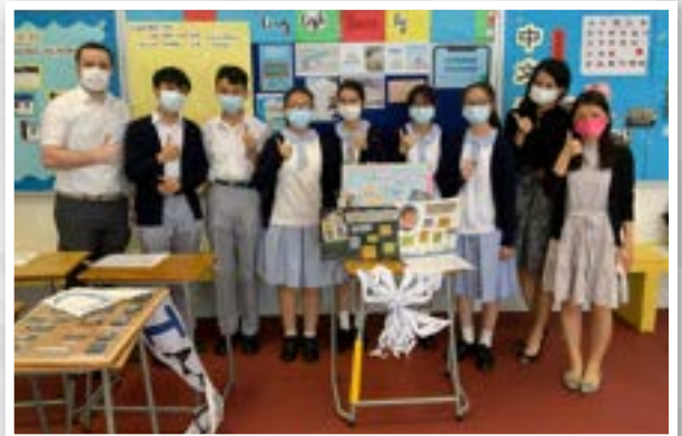
Our English Ambassadors

The English ambassadors are the English lovers who help organise English activities throughout the year. Our students develop a genuine love of English and a strong ability in using the language in an English-rich environment.