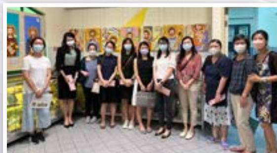
參觀聖約瑟堂畫展