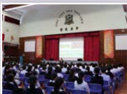
正向教育健康講座