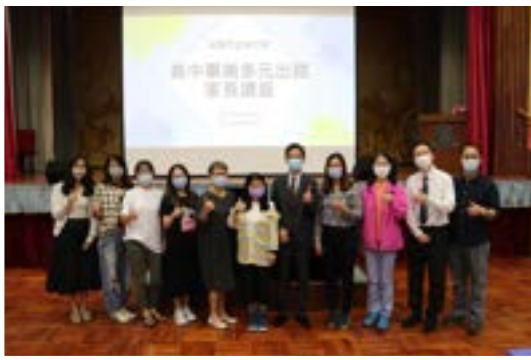
高中畢業多元出路家長講座

本校推行生命馬拉松獎勵計劃，旨在培育學生的責任感及自我管理能力，指引學生在靈德智體群美六育各範疇上自訂目標，及努力達致設定的標準，同時亦邀請家長作評核者，學校按學生的表現在學期結束前頒發鑽石、金、銀、銅獎項，以資鼓勵。