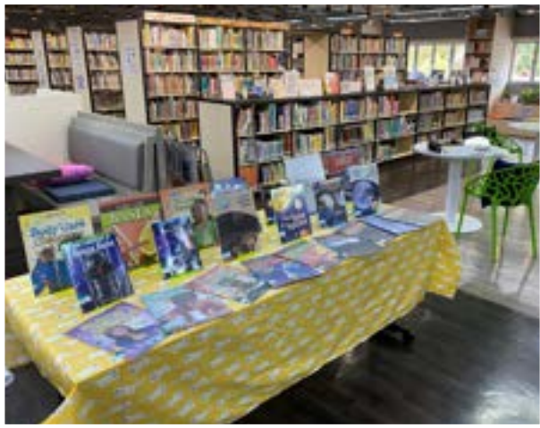
The school library