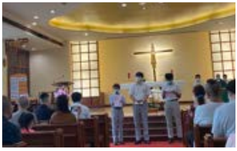
聖斯德望堂教育日

本校在過去數年成功設計了正向教育課程，提升了教學團隊規劃課程的能力，當中的內容包括：認識幸福元素 (PERMA)、培育品格強項等。課程評估的結果顯示了學生在生活目標和意義、社交關係及參與活動等各方面均有所增長。此外，在中國語文、英國語文、通識、綜合人文及中國歷史科均加入了正向教育的元素，把品格強項的特點融入課程中。至於家長教育方面，本校重點在提供資訊，讓家長掌握正向教育的理念，明白品格強項對其子女成長的幫助。