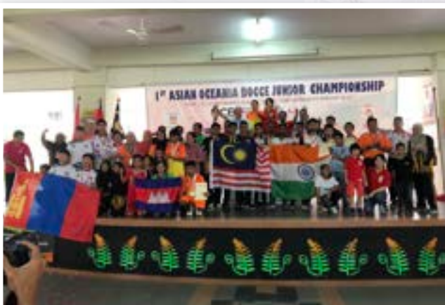
蒞天學生代表香港出戰於馬來西亞舉行的國際意式滾球比賽