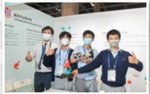
蒞天學生研發的「助」手在科學比賽中獲獎

本校一直致力推行 STEM 教育，培養科研精英，近年在國際及本地的大型比賽中屢獲殊榮，當中的得獎作品包括：超能皮膚、助手及隨機認便等。